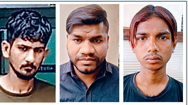
इन बदमाशों को किया तड़ीपार

जिले में पिछले डेढ़ महीने में डेढ़ दर्जन के करीब चाकूबाजी की घटनाएं हुई हैं, लेकिन इन डेढ़ महीनों में एक दर्जन लोगों की हत्या की गई है। इनमें टिकरापारा थाना क्षेत्र में महिला की हत्या की गुरुपुलिस अब तक सुल्झा नहीं पाई है। अक्टूबर में आठ हत्या की वारदात हुई है। उनमें सात हत्या दीपवली के समय हुई है। नवंबर में पिछले 20 दिनों में दो महिलाओं सहित चार लोगों की हत्या हुई है।