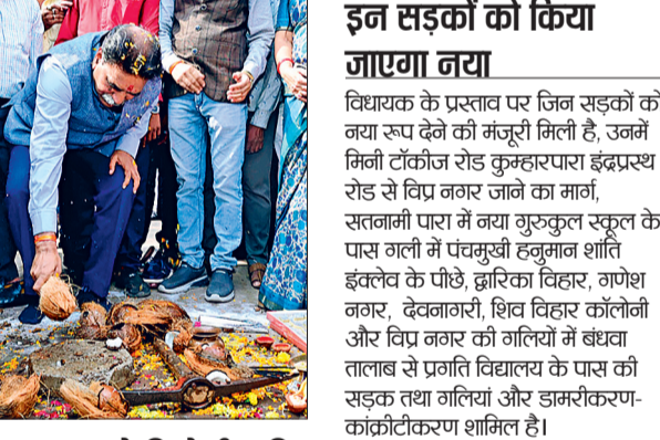
लाखों लोगों को आवागमन में मिलेगी सुविधा